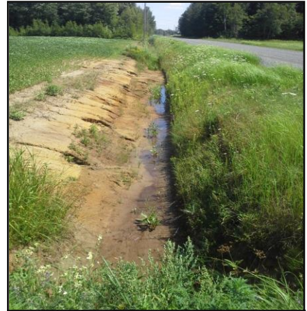
Cours d'eau ayant l'apparence d'un fossé et empruntant un fossé de voie publique

COMPÉTENCE Toute MRC a compétence exclusive à l'égard des cours d'eau, qu'ils soient à débit régulier ou intermittent, y compris ceux qui ont été créés ou modifiés par une intervention humaine, à l'exception de certains fossés. Des personnes sont souvent désignées au niveau local (municipalité) pour accomplir certaines tâches.