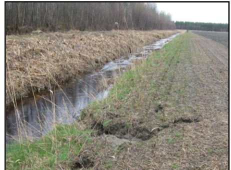
Érosion en champ due à une bande riveraine déficiente

COMPÉTENCE Toute intervention dans la rive doit être autorisée par les inspecteurs de la municipalité locale , telles que : construction et transformation d'un bâtiment, déboisement, remblai et déblai, stabilisation de berge, etc.