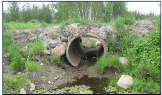
Des aménagements mal conçus peuvent avoir des impacts importants sur un cours d'eau